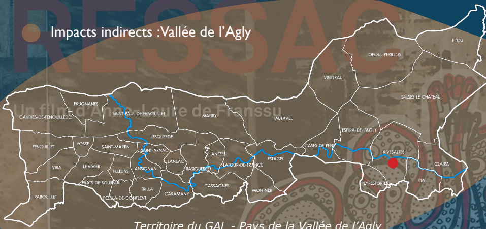
Territoire du GAL - Pays de la Vallée de l'Agly