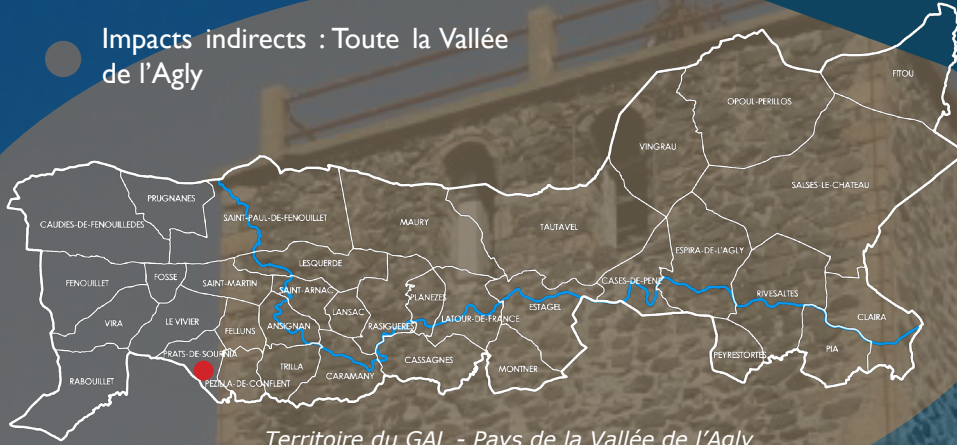
Territoire du GAL - Pays de la Vallée de l'Agly

● Impacts indirects : Toute la Vallée de l'Agly