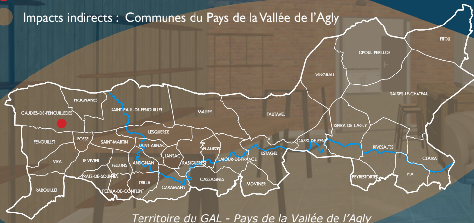
Territoire du GAL - Pays de la Vallée de l'Agly

● Impacts indirects : Communes du Pays de la Vallée de l'Agly