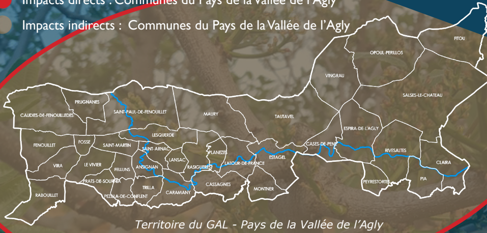
Territoire du GAL - Pays de la Vallée de l'Agly