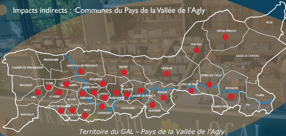
Territoire du GAL - Pays de la Vallée de l'Agly

Impacts indirects : Communes du Pays de la Vallée de l'Agly