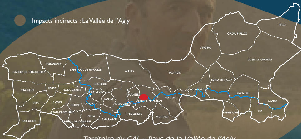
Territoire du GAL - Pays de la Vallée de l'Agly

● Impacts indirects : La Vallée de l'Agly