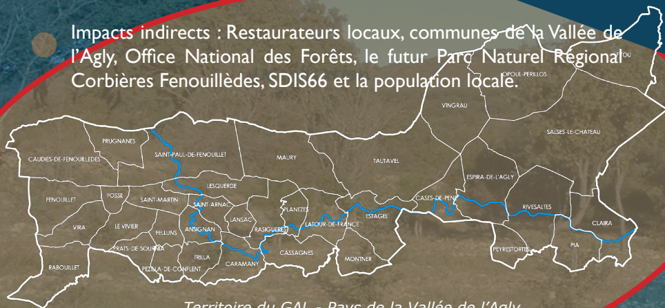
Territoire du GAL - Pays de la Vallée de l'Agly

Impacts indirects : Restaurateurs locaux, communes de la Vallée de l'Agly, Office National des Forêts, le futur Parc Naturel Régional du Corbières Fenouillèdes, SDIS66 et la population locale.