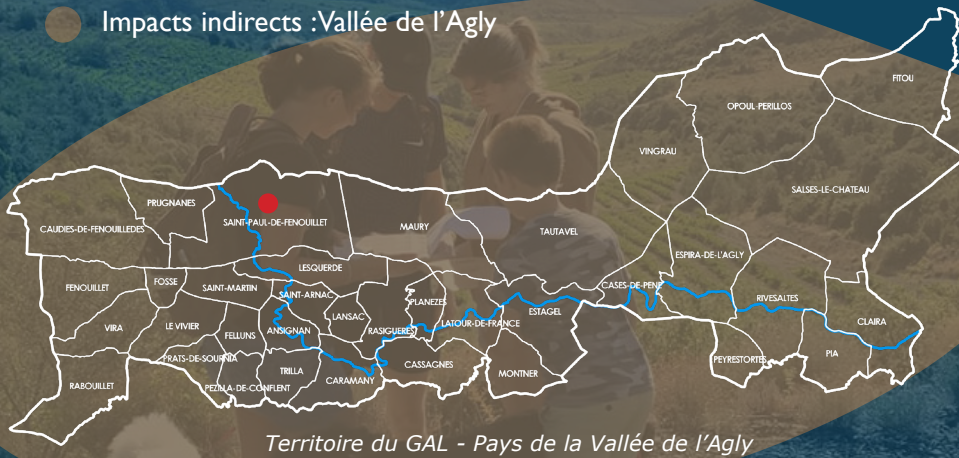
Territoire du GAL - Pays de la Vallée de l'Agly