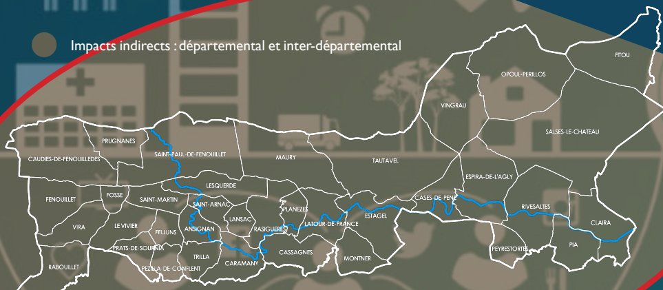
Territoire du GAL - Pays de la Vallée de l'Agly

● Impacts indirects : départemental et inter-départemental