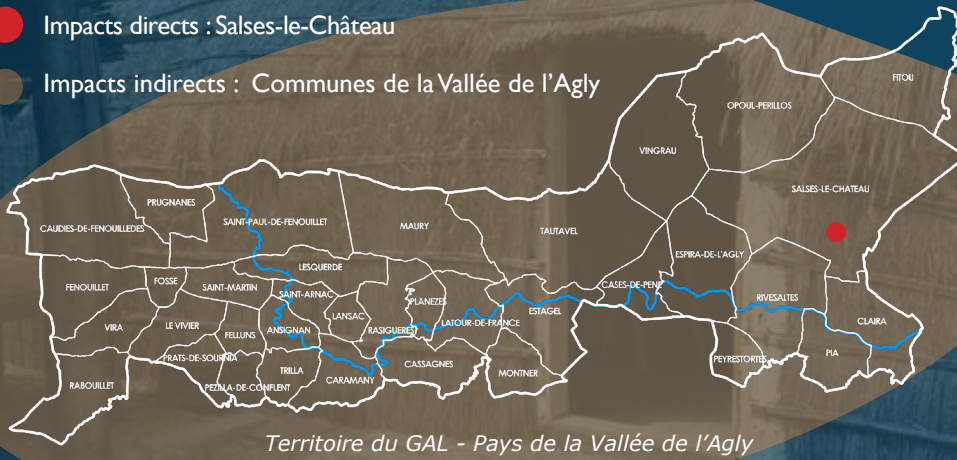
Territoire du GAL - Pays de la Vallée de l'Agly